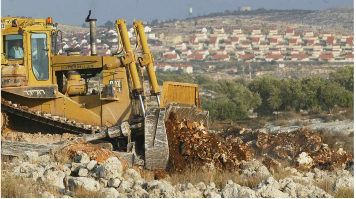
İsraili bir müteahhidin, Caterpillar hidrolik ekskavatörü, 1 Temmuz 2004'te Batı Şeria'nın Az-Zawiya köyündeki Filistin topraklarında İsrail'in ayırma çitinin yolunu temizlerken görülüyor.